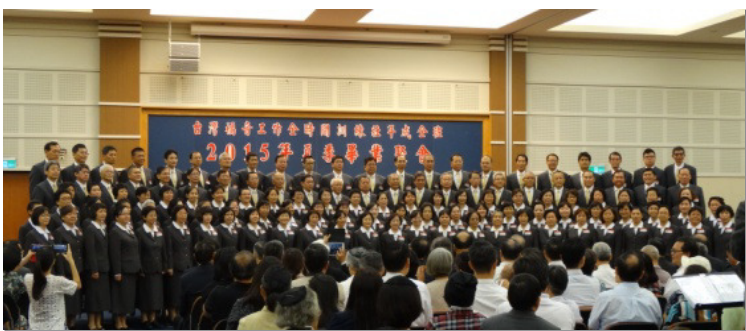
▲畢業學員展覽詩歌