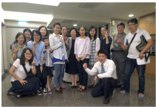
▲弟兄姊妹一同出外訪人

下半年度，我們仍願積極傳揚福音，照著主所給我們的託付，竭力拼上，使萬民作主門徒。 (張勝昌)