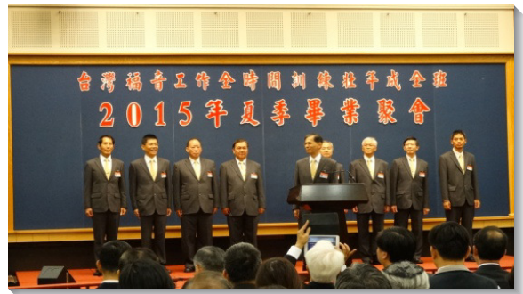
▲畢業學員分組分享蒙恩見證

學員們展覽的第三首詩歌為『主耶穌，我是真愛你』，多人流淚回應主愛，願意答應主的呼召，作主瘋狂愛人，等候主再臨。隨後，第二階段的四組學員繼續作見證。一位弟兄從前不願開口禱告唱詩，也不想申言，