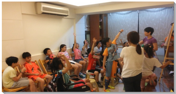
▲兒童在家中小排聚集

第一，我們藉著親密的關切，流通神聖的愛。服事者引導孩子們在排中彼此關切，敞開交通，更彼此代禱。一次，孩子們同為一位小朋友的媽媽和姊姊參加兒童排禱告，姊妹們也積極邀約她們。隔週，這位小朋友的媽媽和姊姊果真順利前來，眾人一同喜樂。家長之間也因為排生活的聯結，加多親密的交通與禱告。