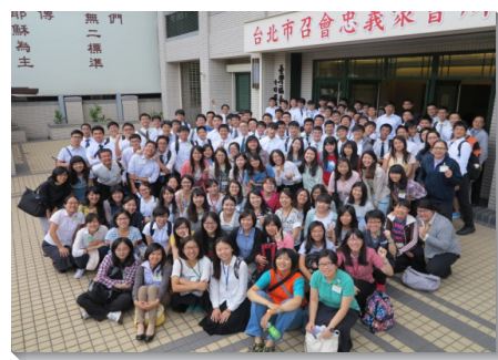
▲大學聖徒於忠義會所聚集

文山一區五十位大學聖徒與六個服事的家，於陽明山會館舉行特會。會中交通到如何生機的牧養照顧召會，學生與在職的家分組討論聖經中牧養的事例，藉著相調與交通，許多弟兄姊妹願意敞開，眾人一同被喜樂充滿。求主興起長久、每日的恢復，使各校園的見證更加明亮。（王俊民、邱欣晨、林喬智）