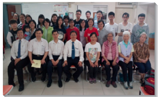
▲聖徒與初信者合影

一年半以來，得救人數已超過一百位。弟兄姊妹們深覺亟需進一步成全初信者，使他們認識真理，看見關於