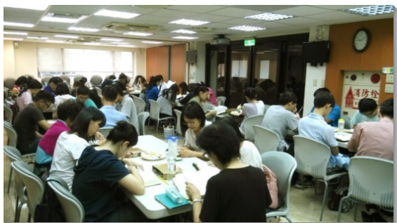
▲弟兄姊妹們分組追求

八月十二至十三日、十九至二十日還有兩個梯次的追求聚會，分別在一會所及二十九會所舉行。願主吸引更多青年人，花時間裝備真理，被神注入。（王興睿）