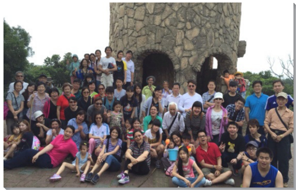
▲弟兄姊妹們出外相調

經過五個月的相調與成全，弟兄姊妹們中間越來越有同心合意的光景，為著福音的信仰一齊努力。七月十二日為年中福音收割聚會，眾人早在一個月前即開始交通、籌備。因著弟兄姊妹們半年來的勞苦經營，與會人數超過六百六十位，比主日聚會平均人數超出