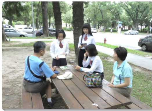
▲受訓的學生們配搭出外傳福音

此外，訓練安排學生們每天花半個鐘頭出外傳福音。學生們都受到羅馬書一章十六節，『我不以福音為恥；這福音本是神的大能，要救一切信的人。』的激勵。許多人的屬靈情形因而有所突破。有人見證，他生性內向，連發單張都覺得膽怯，但看見同伴負擔迫切，便受激勵而向主禱告，要求自己每次至少要發出二十張單張。藉著多方的禱告，學生們靈裏焚燒，經歷福音