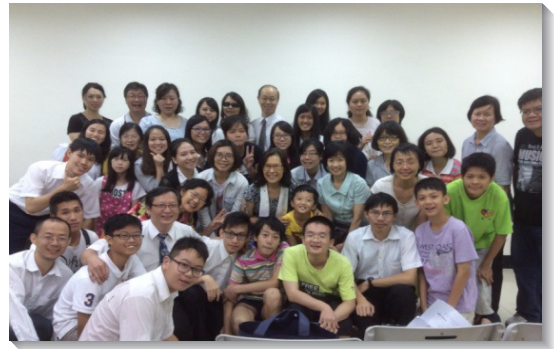
▲青少年、大學聖徒與服事者們合影

今年暑假，有二十位學生參加教學班，許多不常參與召會生活的學生及家長藉此與我們調在一起。在學習的過程中，他們領悟彈奏樂器的目的並非要顯揚自己，而是要藉此享受主、與主交通，並操練忠信服事主。服事者還特地邀請幾位失聰或失明的聖徒來訪，與我們合奏樂器並合唱詩歌，並以自身的經歷激勵學生們，在困境中信靠主而往前。