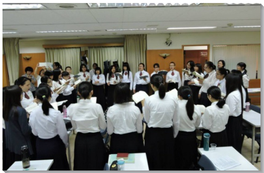
▲學生們會中唱詩，彼此挑旺