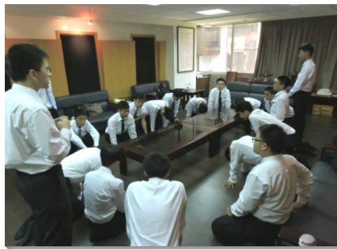
▲學生們為福音開展爭戰禱告