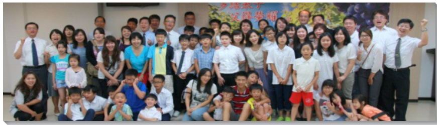
▲小六畢業生參加受浸聚會