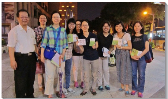
▲學生們與各地聖徒配搭開展

開展行動期間，學生們住在一起，過團體的神人生活，每天規律的晨興、個人禱告和讀經。上午在一會所追求，弟兄帶領我們在真理、生命、和事奉上接受成全。在真理方面，每週有五堂真理課程，研讀以弗所書和腓立比書。我們逐章逐節，甚至逐字讀經，主的話照亮我們，如詩篇一一九篇一三〇節所說，『你的言語一解開，就發出亮光，使愚蒙人通達』。藉著小組交通、研討問題，我們深入挖掘主話的豐富。弟兄們鳥瞰與加強的話，以及每堂末了的展覽，都開啓我們屬靈的胃口，渴慕裝備真理，講說真理的話。在生命方面，藉著進入『生命的經歷』一書，我們不僅得著啓示，也操練著主話，清理對付我們的心，對主有正確的經歷。一位姊妹見證，她看見自己乃是屬主的人，主權已經轉移，願意將自己絕對的奉獻給主。在事奉方面，弟兄姊妹們彼此分享，見證主在我們裏面的運行，推動我們同祂向外開展。在眾人的交通中，我們更認識自己是在身體中配搭行動，並非單獨屬靈，乃是為著建造基督的身體。