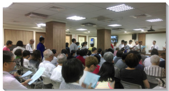
▲八月初舉辦之福音聚會