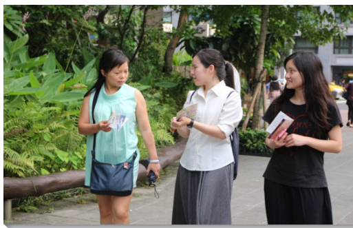
▲學生們操練出外接觸人，湧流生命

認團體禱告是何等的關鍵，藉著禱告，眾人靈裏焚燒，與主是一，為要成就主的旨意。在一次團體禱告中，我們禱讀約翰福音十五章五節。弟兄姊妹被主話深深摸著，認識自己算不得甚麼，惟有主是葡萄樹，祂要分賜生命給我們，我們需要住在祂裏面。還有一次，一個同伴禱告說，『弟兄姊妹，我愛你們！』眾人彼此挑旺，靈被點活，開始珍賞身旁的弟兄姊妹。我們能見證，藉著同心合意、彼此相愛、並住在主裏面，主就使我們多結果子。