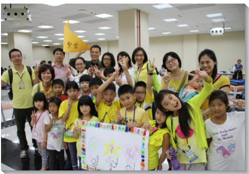
▲中正萬華等大區兒童與家長參加體驗活動

此次主題為性格操練三十點的第一組『真、準、緊』。盼望親子一同操練『說話真實不虛假，作人真誠不應付』、『時間準確不誤事，話語準確得信靠』、『緊緊跟主不放鬆，生活作息需要緊』。