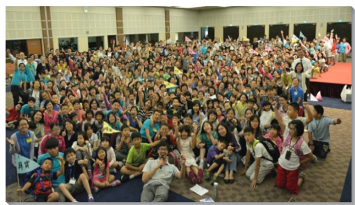
▲文山及大安大區聖徒合影