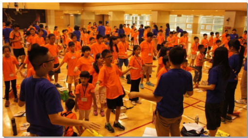
▲信義松山等大區兒童學習詩歌帶動唱

文 山一至四大區和大安一、二大區於八月六至八日，在中部相調中心舉辦親子園。首日晚上，眾人便