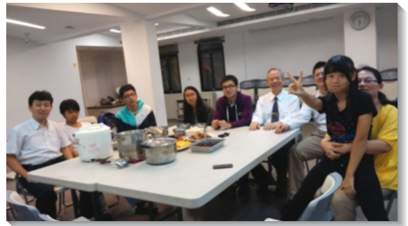
▲聖徒邀約福音朋友在會所一同用餐

至今，每週六的福音行動，已成為我們最甜美喜樂的時間。我們滿帶負擔，樂於與人分享基督的生命，前去叩門訪人、路邊傳講或唱詩。傳福音使我們成為最喜樂的一班人。願眾聖徒都過福音的生活，走出去，宣揚主悅納人的禧年。 (鍾維行)