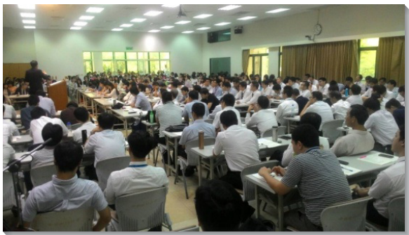
▲關於婚姻之專題交通

特會信息共有五篇，分別為『聖經的中心異象—建造神的家』、『事奉的根據乃是祭壇的火』、『供應生命的服事，產生有生命果效的屬靈工作』、『人人參與，人人盡功用的建造』、以及『經歷聖靈裏面的充滿與外面的充溢』。弟兄與我們交通到，我們若要有分建造神家的事奉，首先必須得著清楚的異象，看見整本聖經的神聖思想，就是神在尋求一班由祂自己所救贖並與祂自