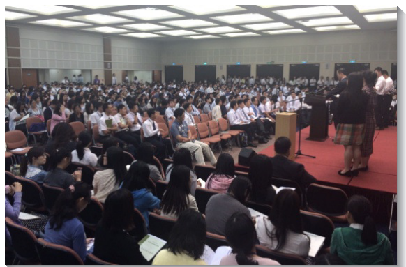
▲青職聖徒踴躍上台，宣告奉獻心願