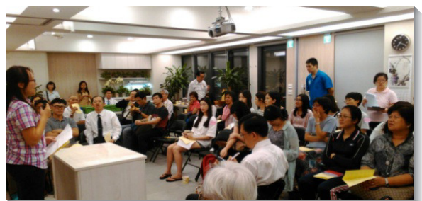
▲聖徒與學生們配搭舉辦福音聚會