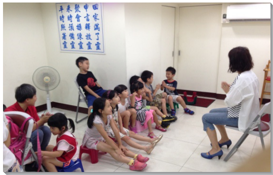
▲聖徒配搭帶兒童排

聖徒們因著開展兒童排，有許多蒙恩的情形。首先，我們經歷稱無為有的神。五十二會所原本沒有兒童排，但藉著一班聖徒領受負擔，經過一個多月的禱告和交通，主就動工，興起許多弟兄姊妹配搭司琴、飯食、接送、課程、活動，兒童小排就被建立起來了。第二，藉著同心合意的配搭，許多兒童及家長就被帶進來。起初僅有三個孩子參加小排，在服事者信心的工作和愛心的勞苦下，目前每週已有十二個孩子穩定參加聚集。第三，兒童排提供了服事的機會，啓發聖徒生機的功用。第四，兒童的家長得著幫助和成全。兒童排聚集