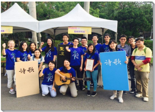
▲大學聖徒於社團聯展擺設攤位接觸新生

今年，在開學以前，許多大學弟兄姊妹便以校內社團作為憑藉，掌握先機，廣為接觸新生。例如北市大、北科、北藝大…等校，學生們利用新生體檢的時間接觸新生，留下大量敞開的名單。有些則在新生搬遷宿舍的期間，主動關切並協助，進而接觸到平安之子。