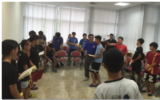
▲學生們出外相調，一同歡唱詩歌