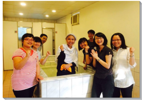
▲學生、學員和聖徒配搭領人歸主

各校園在密集的福音行動中，除了叩訪接觸、家聚會、讀經小組，還舉辦福音聚會、生命教育講座等，各面多方與主配合。東吳、銘傳、文化大學的新生都是在八月底報到，學生與聖徒一同配搭到校園、捷運站、宿舍接觸他們，並邀約至聖徒家中用餐，與他們分享見證。這些校園在節期中，至少邀約了五十位新生來到會所。國立台北教育大學和大同大學的聖徒，