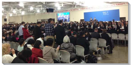
▲ 眾人會中唱詩讚美

末了，弟兄鼓勵我們過一種在兩座壇之間的生活，經歷祂的救贖和代求，並經歷如帳幕的圖畫所豫表之三階段的禱告。首先在銅祭壇應用基督作一切祭物的實際，接著在聖所享受基督的餵養和光照，最後在香壇彰顯基督作香，與祂是一且為著神的權益爭戰。（王興睿）