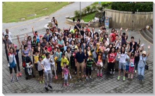
▲兒童及家長一同出外相調

為使這些福音朋友的家庭進入召會生活，我們規畫於九至十二月每週六上午舉辦兒童生命教育課程，共計十五堂課。課程內容涵蓋詩歌、美語及生命教育。同時，我們也舉辦家長座談會以成全家長，並於每堂課程結束後，邀請家長中午一同用餐，使聖徒們有更多機會接觸家長。經過四個月的課程，總計有七十七位家長及九十三位兒童參加，與我們同聚。除此之外，我們更利用雙