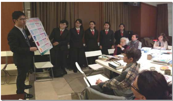
▲學員們至各堂會拜訪，推廣職事書報

早在出發前一個多月，學員們就開始深入閱讀即將推廣的每一本書報，藉著禱告消化內容，自己先從書中得供應，受裝備。學員們也整理出每本書報的摘要和簡介，期能在拜訪堂會時，在最短的時間內，用關鍵的發表抓住尋求者的心。此外，訓練中心每週一晚上還特別撥出一段時間，安排學員分享書報豐富，一面彼此傳輸，一面彼此學習。