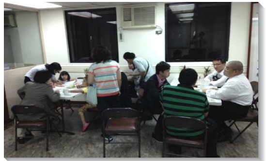
▲弟兄姊妹們邀約朋友到會所福音下午茶

藉著全時間聖徒們的加強，和福音下午茶的實行，更多弟兄姊妹加入了傳福音的行動。會所常時的敞開，也使我們與社區居民之間的距離縮短，週週都有鄰舍朋友進到會所，得著溫暖真摯的關切，聆聽聖徒們三三兩兩在茶點之間傳述的福音信息。讚美主，悅納了我們的奉獻，祝福了身體中的配搭，自十月下旬到年底之間，十六會所共得了二十個果子。我們願在新的一年里，繼續跟隨主的帶領，週週傳福音，時時結新果。（金雍）