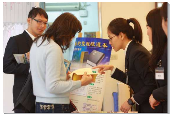
▲學員弟兄姊妹推介書報