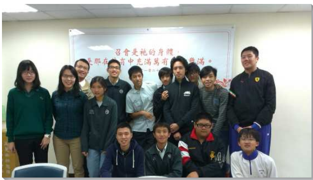
▲學生歡樂參加校園排

十七會所位於師大附中、大安高工以及延平中學旁，長年來一直有三所校園排的服事。每週聚會人數大約有十五位學生、五至八位服事者。校園排使同一所校園裡的學生能聚在一起享受主，成為屬靈同伴彼此扶持鼓勵，並對同學有負擔，在排中傳福音，