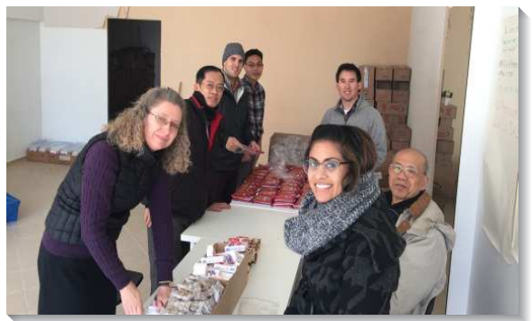
▲聖徒配搭希臘開展

我們能見證，發送工作實在滿了主的同在，各地聖徒擺上奉獻，提供物資，並且同心合意配搭。現今，我們需要迫切禱告，求主開人的心眼，願意接受救恩，也為歐陸國家難民處置政策祈求，為能助於福音的開展。盼望主差派更多工人前去，收割祂的莊稼。（彭明忠）