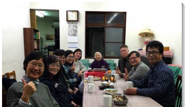
▲聖徒相調甜美的召會生活

音，有位大學剛畢業的姊妹，因參加去年九月的青職特會，接受從主來的託付，堅定持續傳揚福音，就陸續帶領她的同學和朋友受浸得救；還有位剛踏入職場的青職姊妹，起初不知如何開口傳福音，因著看到聖徒的榜樣，就和姊妹們配搭，也每週分別時間到校園傳福音，終於結出她的第一個果子，這位姊妹流淚讚美主，是主的豐富讓她能在傳福音及牧養的過程中供應出新鮮的酒和油，如今她仍為這位小羊迫切禱告，使他的生命能漸漸長大成熟。（盧時安、駱華生）