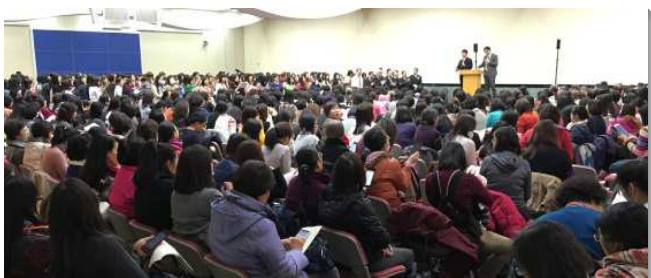
▲姊妹事奉成全訓練聚會

訓練共有三篇信息：第一篇是在傳福音得人的事上親自勞苦，建立活的榜樣；第二篇是實行神命定之路惟一的需要：實行家聚會，定期探訪人；第三篇是藉禱研背講被構成，人人申言建造召會。並有二個專題交通到姊妹的特點及功用。