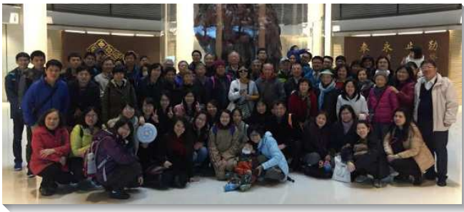
▲ 聖徒們外出相調事奉交通

二月二十七日，我們有超過一百位聖徒到林口會所事奉相調，交通兩項主要的負擔：第一是人人作福音祭司，週週分別一個晚上外出傳福音；第二是推動人