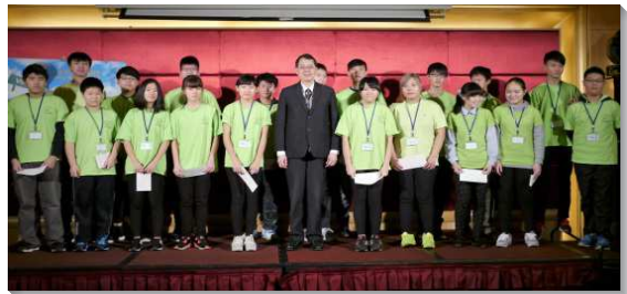
▲生命教育—得榮少年頒獎餐會

每學期，基金會均開辦六次『快樂學習』課程，每次都有超過八十位青少年和服事者參加。有青少年在學習