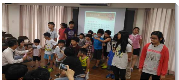
▲兒童讀背經的見證分享

最後眾人相約進入新一季讀背經的範圍，各家享受讀背經的喜樂，繼續讓主話充滿。 (何佳靜)