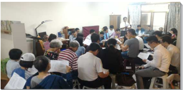
▲聖徒傳福音，人數增加而增區

在福音方面我們的實行有：一、馬路福音。我們已實行近三年。每週三、四，聖徒和學員一同到校園、賣場、捷運站、公車站、運動中心等處大量接觸人。過程中，我們接觸到一位久不聚會的聖徒，藉著聖徒的配搭牧養，他產生對人的負擔，為家人得救禱告，在身體的配搭下，他的家人簡單的相信並接受主。