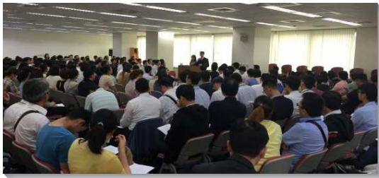
▲青職聖徒成家成全聚會

第一學程有兩篇信息，分別是『家在神經綸中的重要性』與『擇配』。首篇信息說出家是神聖經綸中神分賜的單位，用以過召會生活、進入方舟、享受神的救恩、事奉活神以及傳揚福音最恰切的所在。讓青職聖徒們清楚了解，成立家的重要性。第二篇，擇配為青職聖徒們樹立重要的考量，在選擇另一半時，必須是奉獻給主的、性情相合的、以及考慮身體健康情形等因素。