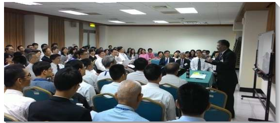
▲大學教職聖徒聚會見證分享

的真理，以及適切的漢語聖經翻譯，就是恢復本聖經，實在需要在中文世界中，作積極的陳明與推廣。為著在中國大陸的傳福音與成全人，尤其需要為倪柝聲弟兄的思想與著作辯護。弟兄鼓勵經過多年學術寫作訓練的教職聖徒拿起負擔，撰寫並陳明倪弟兄思想的學術論文，以匡正外界對其不理性的敵視與汙蔑。