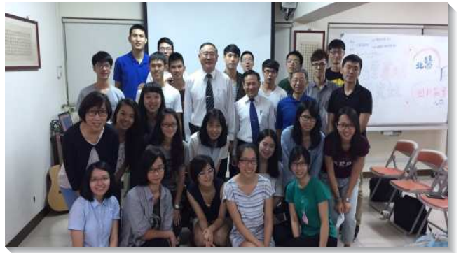
▲畢業校友回校園配搭福音講座

校，向學生分享他們信主的生命故事以及如何在職場中為主作美好的見證，在場者都得著供應。