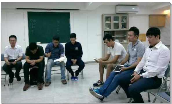
▲聖徒為福音竭力禱告

弟兄們交通到我們需要改觀念，從請人來聚會轉而送會到家。所以聖徒們三三兩兩配搭到人家裏看望、顧惜