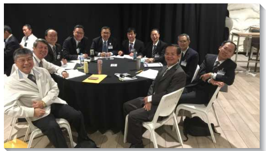
▲弟兄們分組複習信息

第八篇『在老底嘉的召會』（啟三14~22）。是豫表走了樣的非拉鐵非；弟兄相愛失去，變成眾人的意見。特點是不冷不熱和有屬靈的驕傲。我們需要勝過不冷不熱和驕傲的光景，並出代價買所需之物，且開門讓主進來。