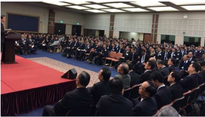
▲ 全台同工訓練聚會

在第一篇信息，說到基督的牧養是為著伯特利，神的家。在創世記我們從雅各的一生中，看見神如何牧養他。第二篇信息說，基督的牧養為著父的家，從約翰福音看見基督是好牧人，為羊捨命，使我們有分祂神聖的生命。祂以自己餵養我們，使我們成為一群，歸於一個牧人，祂牧養的目的是要將我們帶進與祂的調和及建造裏。