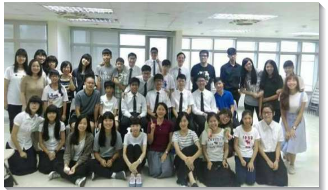
▲學生們參加校園小排聚會

青少年：目前有五個校園排，其中一個校園排在校園附近的會所，另外四個校園排分別有四個家為學生打開家，有聖徒領受負擔，為著打開家特地搬到校園附近。青少年們藉著小排聚集，彼此作同伴，為同學代禱並邀約人。平時也有青職聖徒與他們晨興，關心陪伴他們，讓青少年在生活中享受主，也有榜樣可以跟隨往前。