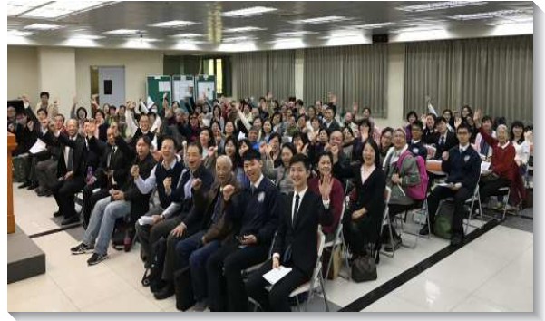
▲聖徒們外出事奉相調

以西結書三十六章三十七節：我要加增以色列家的人數，多如羊群；他們必為這事向我求問，我要給他們成就。為此弟兄們盼望每週二有九十位聖徒能參加禱告聚會，為確定的對象提名禱告。我們也需要週週分別固定的時段出去傳福音，收割祂的莊稼。