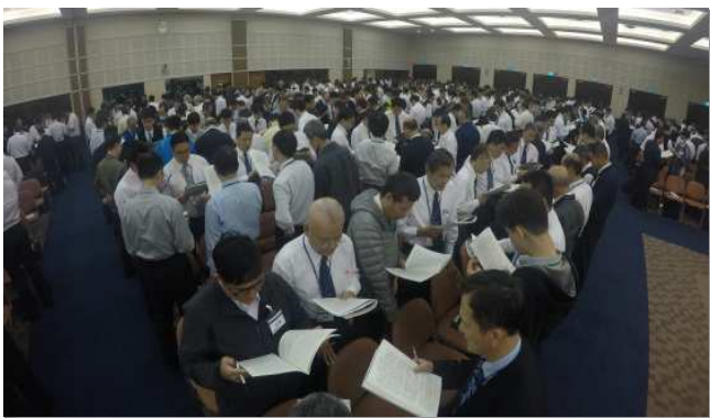
▲事奉成全集調中，弟兄們研讀信息

交通的要點如下：我們要與升天基督天上的職事合作，首先必須尋求、思念在上面的事，在上面的事包含基督升天、登寶座，以及被立為元首、為主、為基督。以弗所書啟示祂向著召會作萬有的頭；在希伯來書看見祂是先鋒、開拓者、是大祭司、是真帳幕的執事；在啟示錄，我們還看見祂是登寶座者，有七角、七眼的那位羔羊，為著神的經綸作神行政的中心。我們不僅要認識祂的所是，更要知道祂正在作的事。祂牧養神的群羊，繁殖復活的基督，並作為大祭司為我們代求，祂還供應我們，使我們能以實行召會生活；至終，祂還傳輸祂自己，作我們信心的創始者與成終者，使我們憑著忍耐奔那擺在我們前頭的賽程。