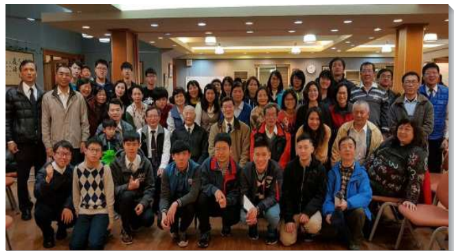
▲聖徒們至花蓮相調訪問

在這次相調中，我們聽見花蓮的聖徒見證他們天天先在家中個人晨興親近主，享受晨興聖言進入真理，並出代價於早晨六點到會所團體禱告操練靈所蒙的恩典和祝福。我們也看見並經歷四活物的配搭。願主祝福各地的召會都有輪隨著活物，活物隨著靈，靈往那裏去，活物就往那裏去。（楊珊珊）