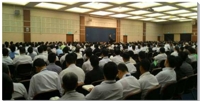
▲全台弟兄事奉成全集調聚會

關於全台青年得一萬。台南市召會負責弟兄領受負擔，從去年開始，率先週週固定一個時間出外傳福音，出訪人數一直增加，今年盼望能穩定在三分之一以上的人出訪。台中市召會看見福音行動需要有計劃和安排、絕對相信禱告以及仰望主的祝福。召會要按時結果子，就需要訂定目標，目前台中每週約有五分之一的聖徒出外訪人，已受浸三百人。北市六會所從七年前開始鼓勵聖徒外出傳福音，至今已超過三分之一的聖徒，過程雖有艱難，但聖徒們堅定持續週週走出去，越過越有負擔、跟隨的人也越來越多，受浸的人數也不斷增加。我們還需竭力的禱告，求主挑旺眾聖徒裏面福音的靈。