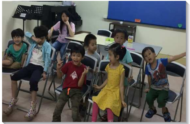
▲孩童們在主日分班中受成全

每個主日，孩子們按年齡分班，彼此作同伴受成全。在每個月會所的集中主日，兒童們單純真摯的展覽，激勵聖徒們更寶愛召會中的孩童。（林雅婷）