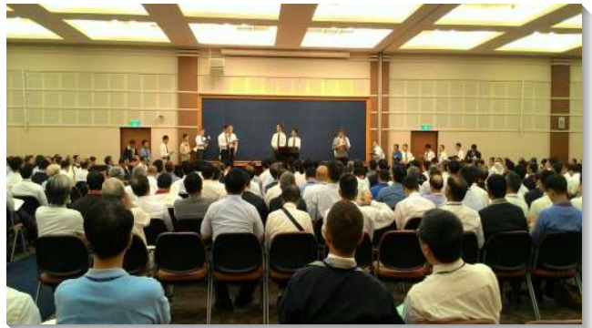
▲弟兄們在事奉成全集調中，上台分享

今天世界局勢都在主主宰的手中，神在地上有祂的行動，需要我們與祂配合。一年多前，主藉著中東的難民事件，在歐洲有許多的改變，這些說出主在歐洲，特別是在德國，有祂特別的行動。台島眾召會越交通就越有負擔，覺得眾聖徒應當一同有分主當前的行動。現在德國有幾處大城市，都有台島眾召會的扶持配搭。聖徒們可以利用三個月免簽證的機會，去配搭短期的開展。無法前去的聖徒，也可以為開展工作上的需要擺上財務。主的行動，更需要眾聖徒的禱告，因為聖靈有工作，仇敵也會破壞，惟藉著我們同心合意的禱告，與主一同爭