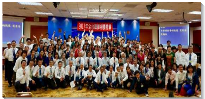
▲ 全台手語與聽損聖徒相調特會