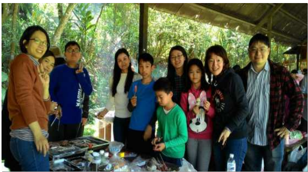
▲聖徒一同外出相調

十六會所弟兄姊妹們多年來在新路的實行上，都緊緊跟隨職事的帶領，無論在福音叩訪，家聚會牧養，或是申言操練，總有一班忠信的聖徒，週週堅定持續的實行，認真操練。近來我們對於兒童專項服事更是有迫切的禱告，積極尋求交通，希望在人力不足和服事度量上，能有所突破。為此聖徒於四月清明假