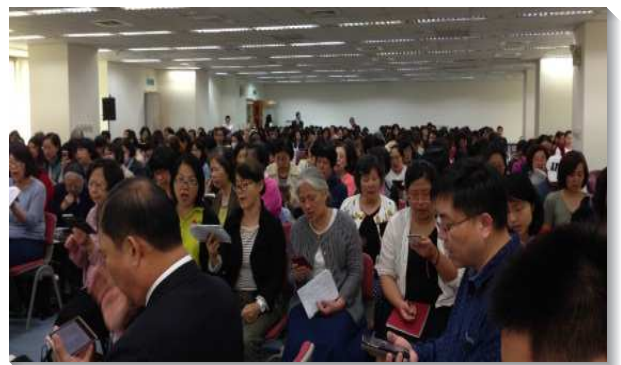
▲ 信松、港湖大區姊妹事奉相調聚會

的，需要我們經歷基督作大祭司，把神自己供應到我們裏面。我們天天來到祂跟前，就享受被拯救到底的生活。並且祂藉著代求拯救我們，我們也該在祂的代求裏為別人代求，顧到祂在別人身上的權益。祂作真帳幕裏的執事也供應我們，以實行召會生活。最後，我們應仰望祂作我們信心的創始成終者，好憑著忍耐奔跑賽程。