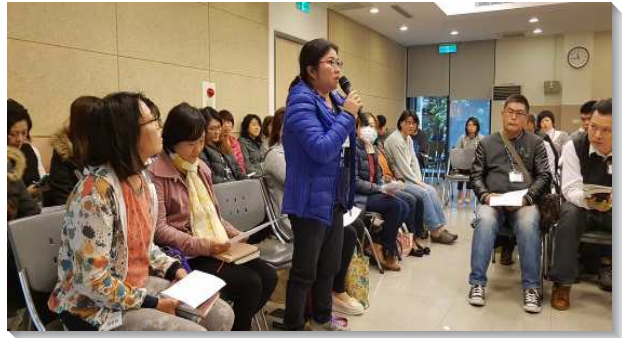
▲聖徒陪伴新人參加成全訓練

有八成新人因成全得著啟示，願意出代價分別主日，準時赴會。有新人見證在分組操練呼求主名時，被自己的靈震撼到，初次嚐到主名的甘甜。又有許多新人、甚至多年得救的信徒，觀摩禱讀的示範後，心竅才得開啟認識原來可以如此享受主的話。有位姊妹見證她在職場工作繁重，但這半年多來恢復每日與聖