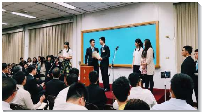
▲青年人上台報號，宣告參加訓練

最後是學員赴海外開展的見證。起初因著語言、文化、宗教背景的差異，以及當地人對福音的誤解，使學員在海外開展時受到為難，也無法配搭帶人得救。但藉著禱告，主使他們看見許多向福音敞開並渴慕真理的人，就更新奉獻自己，顧到主在當地的需要。也因看見自己無論身在何處，都只有一道水流，只為著一個新人的顯出，就從內顧自己的光景裏出來，見證不再是我，乃是基督！無論在印度、德國、斯里蘭卡或是柬埔寨，都能有分祂終極的行動，承擔祂終極的責任。