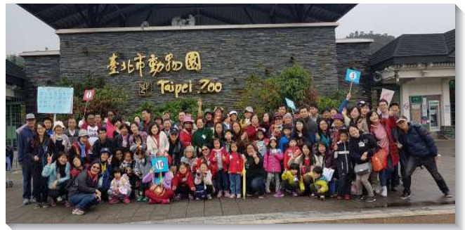
▲聖徒與福音朋友外出相調

相調過程以分組方式進行，聖徒們學習在四活物的配搭裏、在愛裏彼此顧惜同組組員，經歷主給群羊周全、柔細的照顧。午後，眾人則齊聚園區歡唱詩歌、參與大地活動，從年幼到年長的均洋溢喜樂。親子相調中，眾人同心合意與配搭的三一神是一，兒童和家長們向著聖徒們更敞開，願意持續和我們有聯繫，並接受日後相調的邀約。願主繼續加強我們堅定持續接觸兒童家長，帶進一個個的家，進入召會生活。（洪婉瑜、陳翠葳）