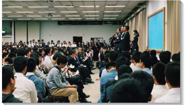
▲學員們作蒙召參訓見證

情形，有的家人反對，有的受世界吸引，有的是已規劃好自己理想的人生，但主向他們發出呼聲，並向他們顯現。有學員在受到反對時經歷主的話，『他們經過流淚谷，叫這谷變為泉源之地；並有秋雨之福，蓋滿了這谷』（詩八四6），而得著神的加力，看見家人的反對是暫時的，惟有主的呼召是堅定的！主也藉著榜樣的見證，使一位弟兄看見榮耀的異象，願意放下屬地的追求參加訓練，讓主能活在他身上，猶如行傳末了，使徒成為主在地上的繼續。