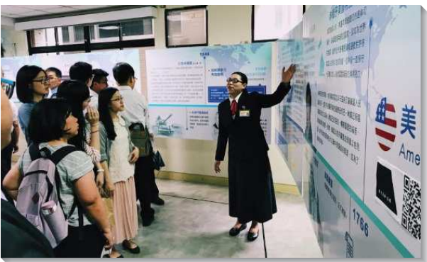
▲學員向聖徒解說召會歷史

在召會歷史中，看見在人類歷史進程中神主宰的手，叫我們更徹醒關心世界局勢，對神的行動更有負擔。海外開展體驗則展出學員在德國發送聖經、在印度和斯里蘭卡陪家聚會、在柬埔寨兒童聚會的場景，並播放學員海外開展蒙恩的採訪影片，加深弟兄姊妹對主在各地行動的印象。在寢室參觀中，藉著內務操練的介紹使青年人看見，最實際接受裝備的路乃是從生活開始，在生活中活基督、彰顯基督。