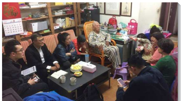
▲聖徒外出送會到家

這樣外出牧養的過程中，讓我們常常尋求主，不要照自己的意思，乃要照主的意思。我們以前被牧養時，所得著與看到的不僅是聖徒的殷勤與熱切，更是主給我們生命上的牧養與恢復。因著我們都被牧養過，所以就更迫切禱告，要從主領受負擔，得著更多的恩典，好叫我們能堅定持續，牧養並恢復久不聚會的聖徒。盼望藉著我們這樣與主配合，不僅禱告仰望，更實際把『會』送回家，而能使召會得著繁殖與擴增。（余受恩）