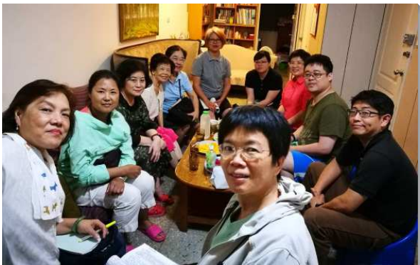
▲聖徒送會到家，看望牧養

四十六會所聖徒操練建立福家架構及實行生養習慣，我們在小排生活蒙恩的祕訣是人人盡功用，小排必須是活動的且滿了生活上的彼此相顧，而不是聚會見面而已。我們更新觀念，從請人來聚會轉而送會到家，各小排中的聖徒三三兩兩配搭到人家裏看望餵養人，並且約定時間一起為著看望的名單禱告，為人代求供應生命。實行下來已看望了許多久未聚會的