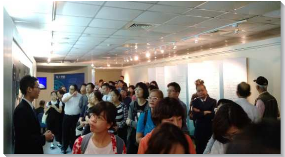
▲聖徒們參觀主的恢復展覽館

二、『主恢復的真理』，弟兄向新人開啟追求真理的胃口，有個人追求聖經的經歷及介紹恢復本聖經的寶