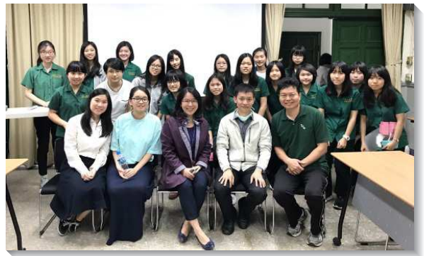
▲聖徒和學生配搭傳揚校園福音

在回饋問卷中，有半數表示願意繼續接受邀約，亦有人有興趣成為基督徒。願主繼續祝福北一女中這校園，並保守這些敞開的對象，能在後續的接觸和邀約中，進入福音小排，與我們一同過召會生活。（張欣瑜）