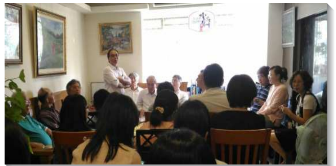
▲聖徒人人在區聚會中盡功用

有位姊妹立志要除去不冷不熱的光景，她要求自己每週要邀十個人來參加聚會，就在她開始實行後，每週都能邀到人，最多還邀來四位。這位姊妹的靈激勵了整個小區，許多弟兄姊妹也開始邀約人，把自己的家人、朋友帶來，更週週配搭去看望，不顧天候，也不管距離遠近，甚至遠至蘆洲、龜山看望，整個小區都得復興。