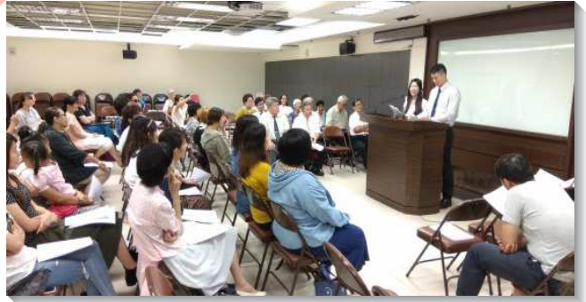
▲聖徒配搭新人成全聚會見證

本會所於五月十四日起至七月底，規劃七次主日上午的新人成全訓練，開啟新人基要的真理，使其懂得分別主日並能於生活中吃喝享受主。七次主題包括：主日及擘餅、呼求主名及禱讀主話、建立晨興、禱告並讀經的生活、聚會的緊要及召會生活、承認主、作見證、傳福音。七次聚會都集中在會所舉辦，由各小區聖徒輪流配搭擘餅聚會的服事，使新人習慣並看重主日擘餅聚會。先擘餅後有新人成全訓練，信息內容由各區負責弟兄輪流配搭，藉此成全弟兄們操練話語服事、教導真理，也請聖徒配上實行的見證，許多的見證都很激勵人，幫助新人樂意實行操練。