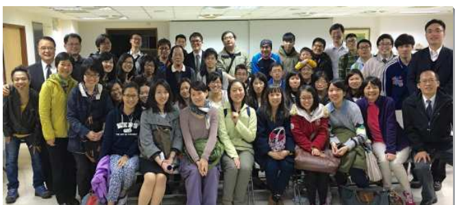
▲青職聖徒成全聚會

十篇，聖徒們把平時所讀的真理要點，操練寫成三百字以內的心得，在中區生命讀經的群組分享。到聚會展覽時，則以會所為單位，每次安排十位青職聖徒操練兩分鐘申言，使人人得加強。