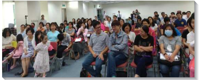
▲兒童服事研討見證聚會

還有位姊妹見證，她的兒子在青少年時期迷上電玩，還帶著弟妹進網咖玩樂，當姊妹向兒子查證時，兒子仍硬著心否認；此時姊妹向主屈膝，為自己的教