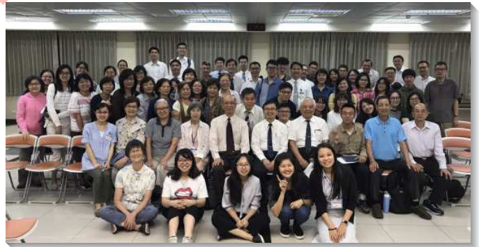
▲聖徒出外事奉相調

實行方面，我們將召會的事奉分為屬靈專項和事務專項事奉兩部分，在屬靈專項服事的聖徒，需要常在一起交通、禱告，尋求所牧養之聖徒的屬靈幸福，並實際的去陪伴、牧養和成全，使他們在生命裏長大。除基本的兒童、青少年、大學專項外，我們還增加一項社區開展專項，盼望聖徒藉著主動聯絡且關心排裏聖徒，並與同伴一同看望、牧養久未聚會的對象及福音朋友，使之能週週有分排聚集的生活，進而達到增排增區的目標。有聖徒見證，在參加事奉相調前，區裏原先想於暑假期間將小排合併，但在聚集中，主即時提醒他們，不能因為暑假，靈就沉睡，反而要繼續竭力往前，外出訪人並傳揚福音。期盼每位聖徒都成