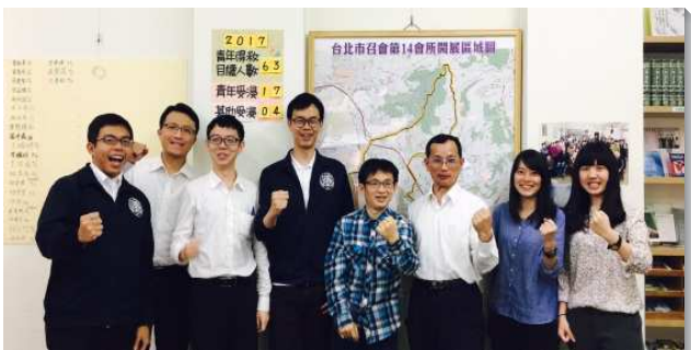
▲聖徒實行新路叩訪及探望

四月份，六位訓練學員前來石牌開展一個月，學員們奮力開展、愛主火熱之靈，厲害的衝擊眾聖徒，出外叩訪人數曾達到八十位，占全會所主日聚會人數三分之一強。我們在預備新增會所的區域，挨家挨戶叩訪，在馬路發送福音單張，並探望禱告過的親友。當