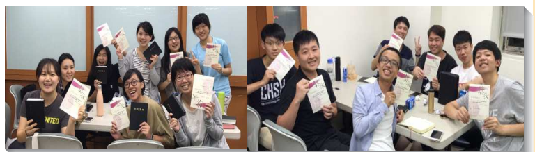
▲大學聖徒喜樂讀完新約聖經一遍

許多學生都喜樂的分享，這是他們首次讀完新約聖經一遍，意義非凡，不只有成就感，也使他們更加渴慕真理。有學生見證，他從小在兒童班長大，原本以為對聖經已有一定程度的瞭解，但在真正讀完一遍之後，才發現自己對於很多真理是非常不了解的，也在讀完後，非常想再深入挖掘註解、書報，以清楚不懂的地方。有學生見證，讀經時讀到很多寶貴的經節，讓他這兩天非常享受主的話，並且相約參加第二梯次的聖經追求聚會。願主更多祝福所有年輕人，藉由扎實的進入真理，更加渴慕泡透在主的話裏，贖回年輕的黃金歲月，受主裝備能為主使用。（邱允辰）