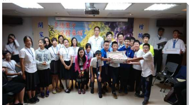
▲青少年們參加特會受成全

經過這次特會，青少年積極惜取少年時、把握每個今天，操練成為今日的約瑟，在生命中作王。家長們也更多認識兒女的情形，有負擔多多關切孩子的屬靈幸福。（邱信一）