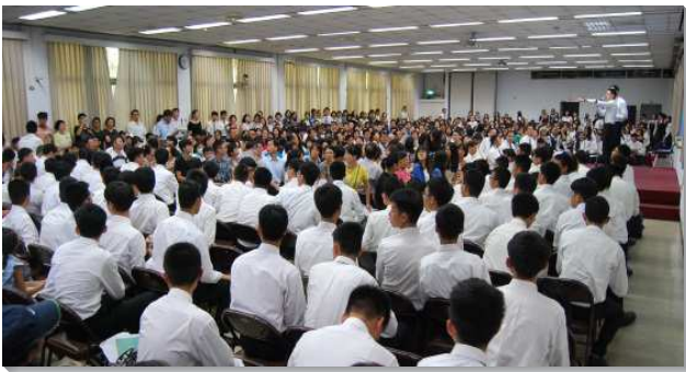
▲全台高中一週成全訓練

全 台高中一週成全訓練，於七月十六至二十二日在台北三會所舉行。今年由台北市召會主辦，共有一百九十九位來自全台的高中聖徒參加。其中一百四十六位是正式學員，有四十四位來自台北市，北市另有五十三位參與配搭事務服事的學員。參訓的學生皆是各地最有心願受成全的高中生，並經過召會的推薦與面談。除了學生以外，還有近七十位來自各地的服事者、全時間訓練學員一同配搭服事。總共近二百七十位聖徒一同有分本次訓練。