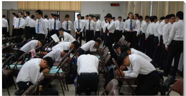
▲受訓學員操練個人向主禱告

本來覺得浴室很乾淨，但藉著輔訓的幫助，更多轉向主而蒙光照，看見自己有許多細節沒有注意到，當她打掃完後，感覺自己也被主潔淨了。此外，學員也操練在緊湊的時間表中準時到會。其中從台北市報名參與事務服事的學生，每天需要比正式學員更早起床，更晚回去就寢，並投入更多時間服事事務。然而有學員見證，雖然一開始會想要抱怨，但後來更多轉向主並取用主的恩典，就覺得能為主多出一點代價是何等喜樂！