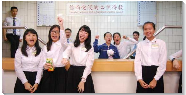
▲受訓學員帶人受浸得救

在生活方面，學員們於每天早晨五點半起床後，便一同呼求主名操練靈。每天的晨興與午禱時間，教師帶領學員們建立定時享受主的習慣。此外，輔訓們每天細心的教導學員如何整理個人的衣物、整潔住宿的環境，操練養成正確的性格。有位學員見證自己在打掃的時候，