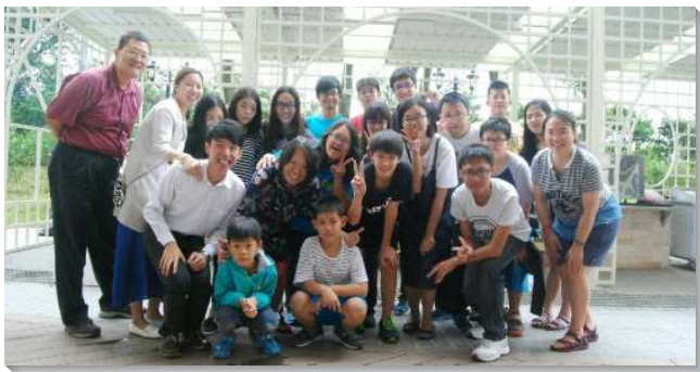
▲聖徒以家為單位服事青少年

已過的一年，有不少青少年得救，但留下的比率卻不高，聖徒們藉著禱告和尋求，看見不僅要得著青少