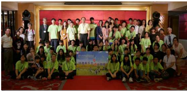
▲得榮少年獎助學金頒獎餐會

頒獎活動，由得榮少年展覽歌曲帶動唱揭開序幕。因著各地召會服事者的勞苦耕耘，多面的接觸人，今年有十八位新生加入得榮的大家庭。之後眾人觀賞得榮少年在暑假出外公服的影片，並邀請三位少年分享他們在戶外公服中，揮汗作農事，體會一分耕耘、一分收穫。當天下午眾人到十九會所，有生命園地時間，邀請大學聖徒分享生命的見證，帶領少年們認識甚麼是永遠。接著得榮少年分批上台，接受多位貴賓頒發獎助學金，少年們在眾人的扶持中受鼓勵，場面溫馨喜悅。