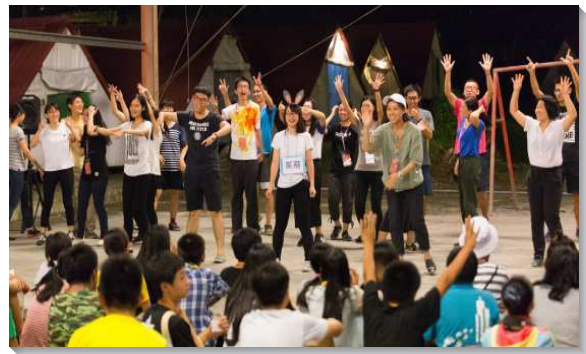
▲大學聖徒在生命教育營隊中傳輸生命

營隊的主要負擔，是幫助花蓮當地的國中生認識生命，學習處理情緒與人際上的問題，並且能夠一窺大學不同的類組、學系，以幫助他們尋求未來的志向。大學生自三月份起一同尋求、編寫、排練、課程，並為了隊員有同心合意、迫切的禱告。課程內容對於參與營隊的國中生，或是進行服務的大學生，都滿了正面的影響。一位自幼在召會長大的大學姊妹，見證她在講授課程的過程中，更加接受、喜歡神所創造的自己。