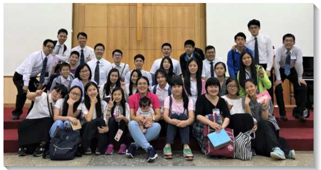
▲聖徒陪伴青少年參加高國中特會

大專專項：有八位大專生和一位服事者參加在東馬古晉舉行的亞洲國際大專訓練，全程英語，讓大專生們靠主竭力操練用英文進入信息及禱研背講。他們的異象被拔高，靈裏變剛強，切慕為基督宇宙身體的需要，豫備好自己。