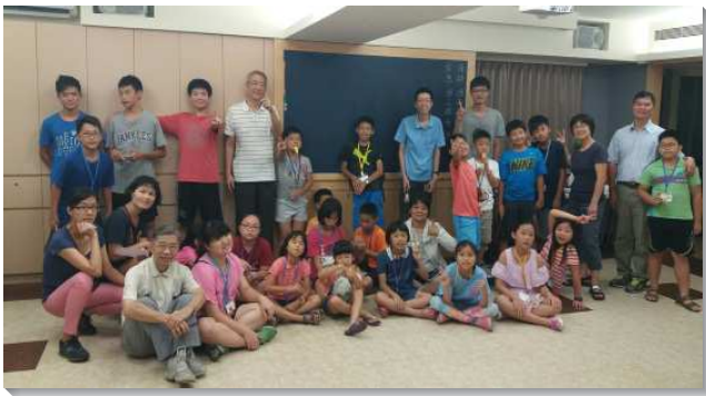
▲聖徒陪伴青少年參加召會活動

主 的恢復是真理的恢復，我們需要將聖徒作到真理裏。四十會所的弟兄們帶領聖徒看重生命讀經的追求，從三月中旬起鼓勵聖徒們每週進入二至三篇以西結書生命讀經，跟上夏季訓練結晶讀經的進度。為了加強聖徒追求的風氣，我們也設立了生命讀經的網路群組，每週更新進度，讓聖徒們在完成後回報，落