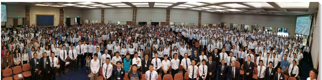
▲青職聖徒相調成全聚會於中部相調中心

明年的青職特會預定於九月二十二至二十四日的中秋連假來舉行，屆時青職聖徒可以不必請假就能夠全程參與，這樣必定會有更多的青職聖徒報名參加，求主祝福祂的召會。 (楊其道)