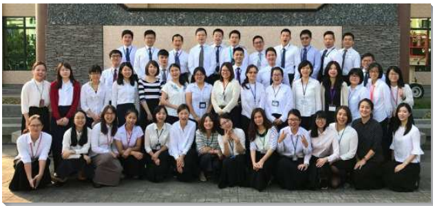
▲青職聖徒相調聚會

特會內容分為四個系列：操練系列、信息系列、專題系列以及成全系列。第一為清晨操練系列。每天的晨興時段都有弟兄帶著與會的聖徒操練，從首日的呼求主名操練靈，次日的禱讀主話操練靈，第三日的對付良心操練靈，把聖徒更深的帶回到靈裏，讓聖徒預備好為著來享受一整天的信息。