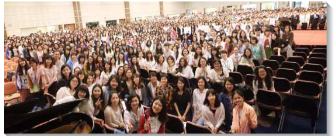
▲青職聖徒相調聚會於中部相調中心

第三是專題系列。特別邀請了父老們，針對青職聖徒最切身的兩大領域—職場及婚姻，給予合適的幫