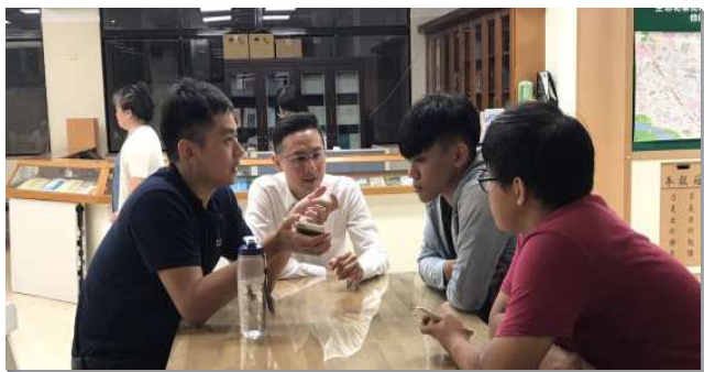
▲聖徒陪新人家聚會

神的祝福已經顯明，八月時兩位聖徒帶他們的同事得救。九月福音節期裏，全時間訓練的學員，邀約福音朋友一起用餐，並且與社區的活力組配搭，兩週之間又受浸了六位。目前八位的新人都持續餵養中，有三位週週參加主日。主日人數平均達到四十人，最多曾有四十八位。願主藉由我們樂意全然奉獻，投入增區的行動裏，在年底的時候，我們能豪邁的增區，讚美主，榮耀歸神。 (葛新路)