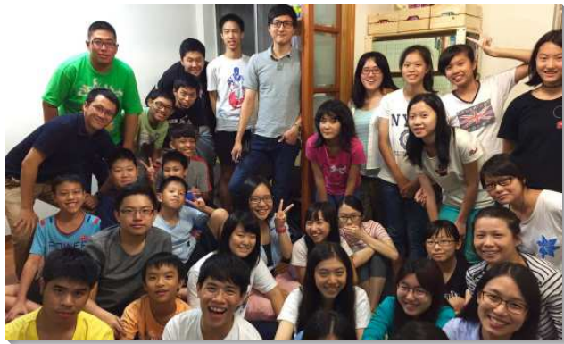
▲青少年與同伴同過召會生活

二、牧養的蒙恩：自二〇一四年起，每週四晚間，姊妹們配搭到會所服事飯食，聖徒下班後邀約福音朋友來用晚餐，藉此傳福音，餵養新人，至今已有十八位受浸。有位久不聚會的弟兄，在路上遇到聖徒發單張，就把他的太太帶來與聖徒用餐，當晚他太太立即受浸。另有兩位年長師母出去發單張，邀來了兩位青年人，當晚也受浸。藉著聖徒們分組配搭，以初信讀本及職事文稿餵養初信者，得救的新人就容易存留在召會生活中。