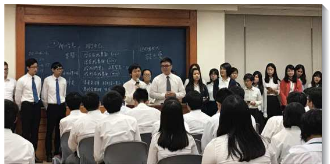
▲大學聖徒於聚會中分享

三、擴大度量，加深海外開展的心志。在兩梯次的成全中，分別有全時間聖徒交通主在亞洲及歐洲的行動。許多大學聖徒深得激勵，盼望在大學時積極有分召會生活，從中得著成全與裝備，於日後能有分主在全地的行動。士師記五章三十一節，『願愛你的人如日頭出現，光輝烈烈』，願主得著所有愛祂的大學青年，在學時豫備好自己，成為主手中合用的器皿。（季祖望）