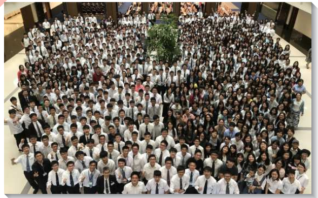
▲大學聖徒期初特會

盼望學生在學期的開始，清理已過的舊生活，再更新奉獻自己，使我們的心單純受主的吸引，將上好的愛奉獻給主。愛主會使我們常活在與主的交通裏，交通更會把我們帶進神聖生命的水流。弟兄們也囑咐學生們，不