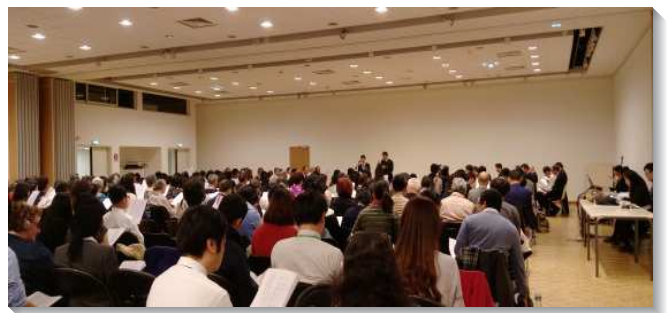
▲各地聖徒參加在法國巴黎的華語特會

在會中有弟兄們的信息供應，也有聖徒們的回應分享、見證加強、會後有史特拉斯堡開展交通。也邀請國內的聖徒交通，有人因信仰的緣故，甚至被下在獄