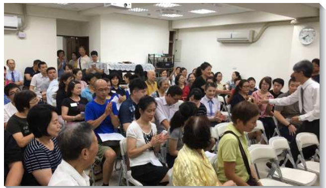
▲ 六十三會所成立，首次福音聚會

在已過的幾年，聖徒們為了繁增會所對於生養教建的實行積極擺上，今年在沒有任何全時間學員的支援下，仍然如此蒙主祝福，使弟兄姊妹們非常喜樂，也更確定這樣的實行使我們的召會生活更實際，對主的享受與經歷更確實。盼望有更多的聖徒能夠出外訪人，使人數更繁增，眾人都蒙恩！（陳韋豪）