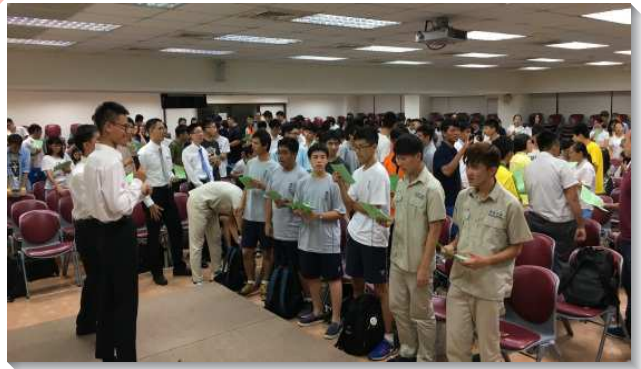
▲高中福音聚會於一會所

這段期間各樣福音的行動，使青少年們有諸多的蒙恩、經歷與突破；有些校園的學生到各班宣傳此福音行動，向同學、學弟妹作見證；有弟兄們中午在校園中屈膝禱告；有的校園之學生與教職聖徒一同禁食禱告。有人突破了自己內向的個性，能喜樂的走出去傳福音；有人以往傳福音，因著面對熟識同學的冷嘲熱諷，覺得灰心，而今卻覺得十分榮耀。